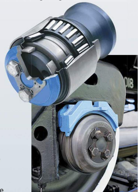
Fig. Das Radsatzlager TBU

Das russisch-amerikanische Gemeinschaftsunternehmen "EPK-Brenco" wurde in Russland zur Herstellung von TBU Radsatzeinheiten für die Eisenbahnindustrie gegründet. Hinsichtlich der verwendeten Produktionsausstattung und Technologien ist dieses Unternehmen für Russland einzigartig. Dank der Zusammenarbeit mit dem amerikanischen Marktführer in der Produktion von Eisenbahnlager – mit dem Brenco Division von Amsted Rail - erreichte EPK ein neues Produktionsqualitätsniveau. Die neuen TBU-Lager sind wartungsfrei während deutlich erhöhter Lebensdauer (8 Jahre, 1 200 000 km), haben eine höhere Tragfähigkeit (mindestens 27 t) und andere verbesserte Qualitätseigenschaften.